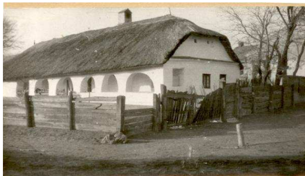
A Szántó ház eredeti helyén, a Dankó Pista és a Nagy utca sarkán. Ma a Szentendrei Skanzenben látható.