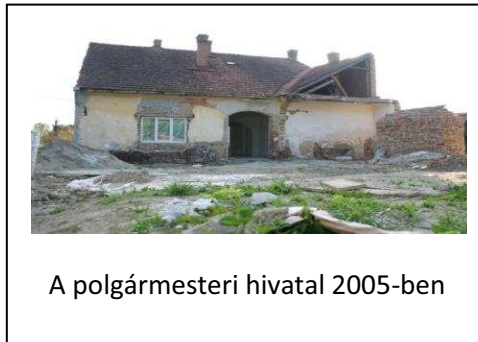
A polgármesteri hivatal 2005-ben

Bagost. A kulturális és társasági élet pedig csak egy vágyalom volt, mindehhez társult a krónikus munkanélküliség, melynek eredménye az lett hogy 1990-től folyamatosan fiataljaink (és nem csak a fiatalok) elvándoroltak, a lakosság száma csökkent, a falu kezdett elöregedni.