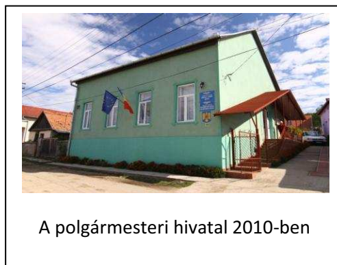
A polgármesteri hivatal 2010-ben

lehívható támogatások. Nem panaszkodhatok, jómagam a Romániai Magyar Demokrata Szövetség tagjaként és polgármestereként, nagyon sok támogatást és segítséget kaptam előjáróinktól, akik községünk érdekeit méltóan képviselték és képviselik mind a mai napig, megyei