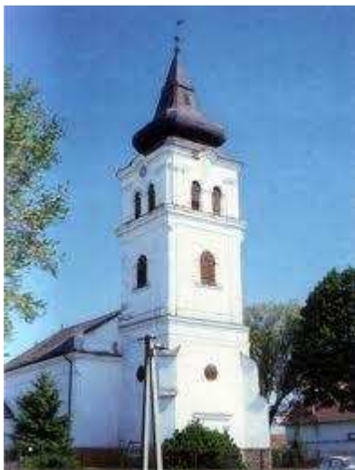
A Hajdúbagosi Református templom